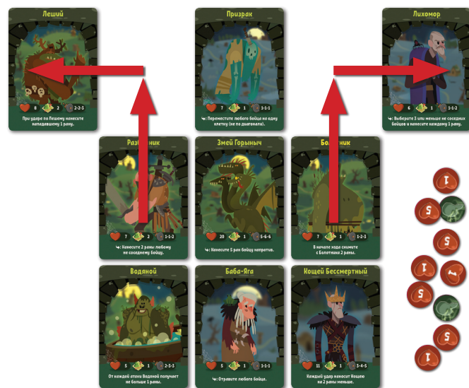
Пример движения карт в первый ход

Если карта закрыта, она не может двигаться.